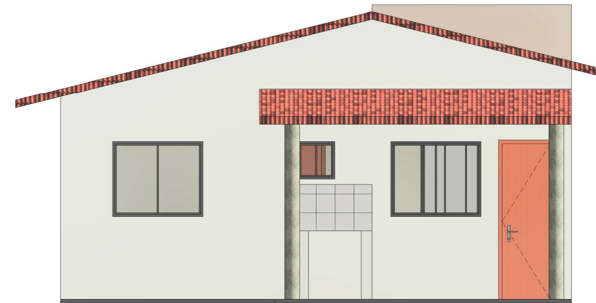
02 FACHADA POSTERIOR ESCALA 1:50