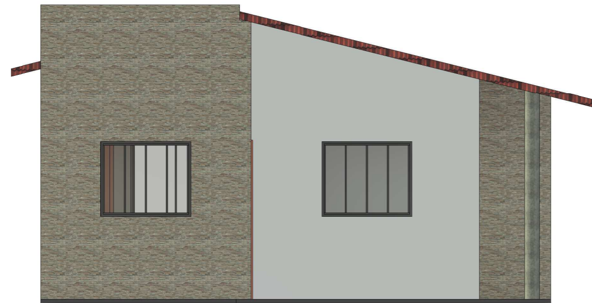
01 FACHADA FRONTAL ESCALA 1:50