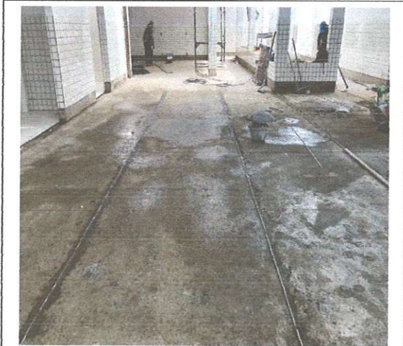
FOTO113: Piso de alta resistência