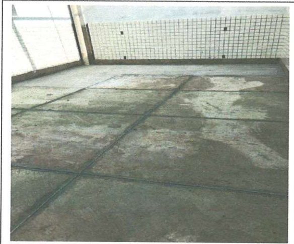
FOTO105: "Filetamento" para piso de alta resistência