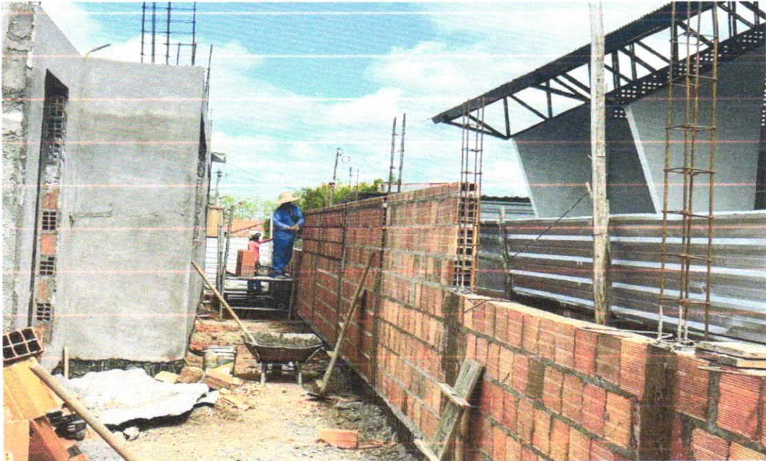
FOTO 08 – Armação de aço CA-50 Ø 8mm; incluso fornecimento, corte, dobra e colocação

FOTO 07 – MONTAGEM E DESMONTAGEM DE FÔRMA DE PILARES RETANGULARES E ESTRUTURAS SIMILARES COM ÁREA MÉDIA DAS SEÇÕES MENOR OU IGUAL A 0,25 M 2 , PÉ-DIREITO SIMPLES, EM CHAPA DE MADEIRA COMPENSADA PLASTIFICADA, 12 UTILIZAÇÕES. AF_12/2015