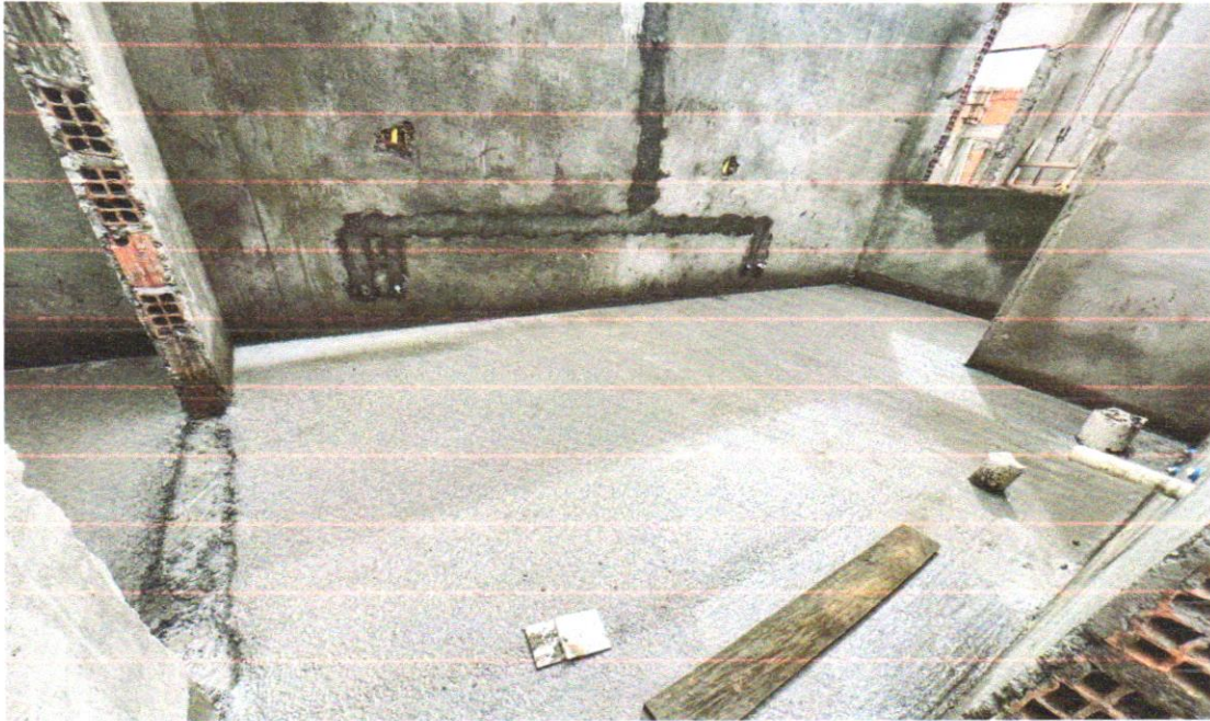
FOTO 18 - IMPERMEABILIZAÇÃO DE PISO COM ARGAMASSA DE CIMENTO E AREIA, COM ADITIVO IMPERMEABILIZANTE, E = 2CM. AF_06/2018