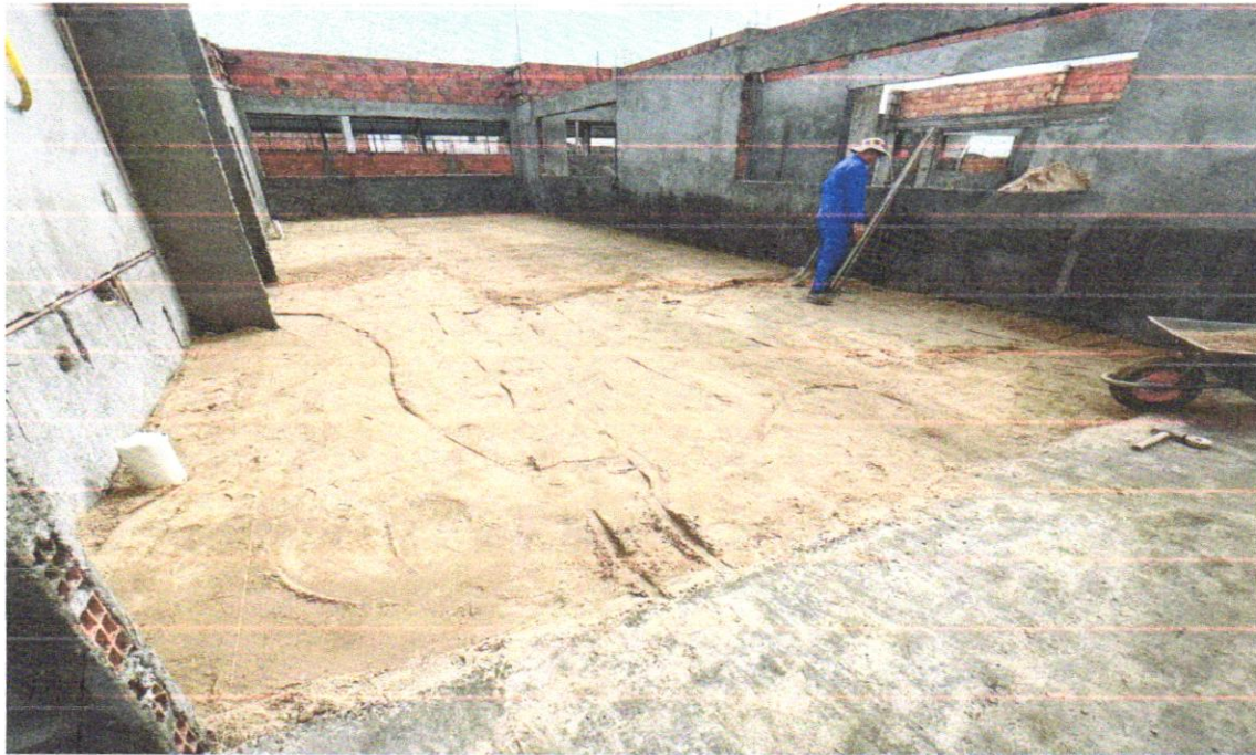
FOTO 06 – ATERRO MANUAL DE VALAS COM SOLO ARGILO-ARENOSO E COMPACTAÇÃO MECANIZADA. AF_05/2016