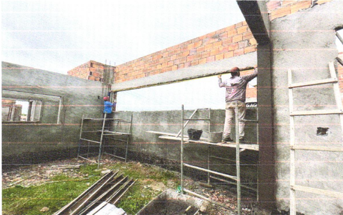
FOTO 16 – ALVENARIA DE VEDAÇÃO DE BLOCOS CERÂMICOS FURADOS NA VERTICAL DE 14X19X39CM (ESPESSURA 14CM) DE PAREDES COM ÁREA LÍQUIDA MAIOR OU IGUAL A 6M 2 COM VÃOS E ARGAMASSA DE ASSENTAMENTO COM PREPARO EM BETONEIRA. AF_06/2014

FOTO 15 – ALVENARIA DE VEDAÇÃO DE BLOCOS CERÂMICOS FURADOS NA VERTICAL DE 14X19X39CM (ESPESSURA 14CM) DE PAREDES COM ÁREA LÍQUIDA MAIOR OU IGUAL A 6M 2 COM VÃOS E ARGAMASSA DE ASSENTAMENTO COM PREPARO EM BETONEIRA. AF_06/2014