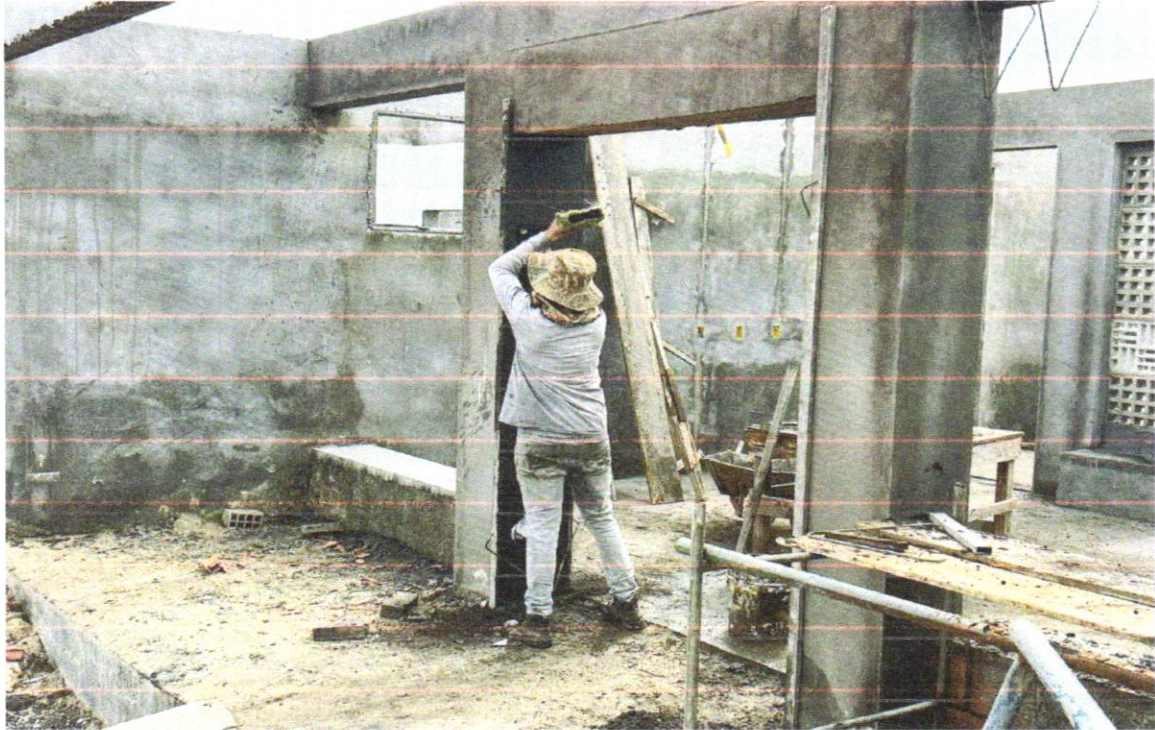
FOTO 22 – Emboço para paredes internas traço 1:2:9 - preparo manual - espessura 2,0 cm

FOTO 21 – Emboço para paredes internas traço 1:2:9 - preparo manual - espessura 2,0 cm