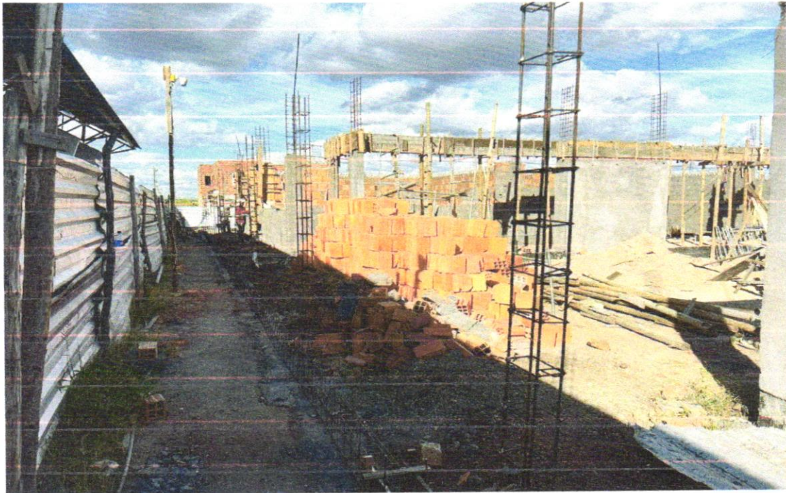
FOTO 10 – Concreto Bombeado fck= 25MPa; incluindo preparo, lançamento e adensamento