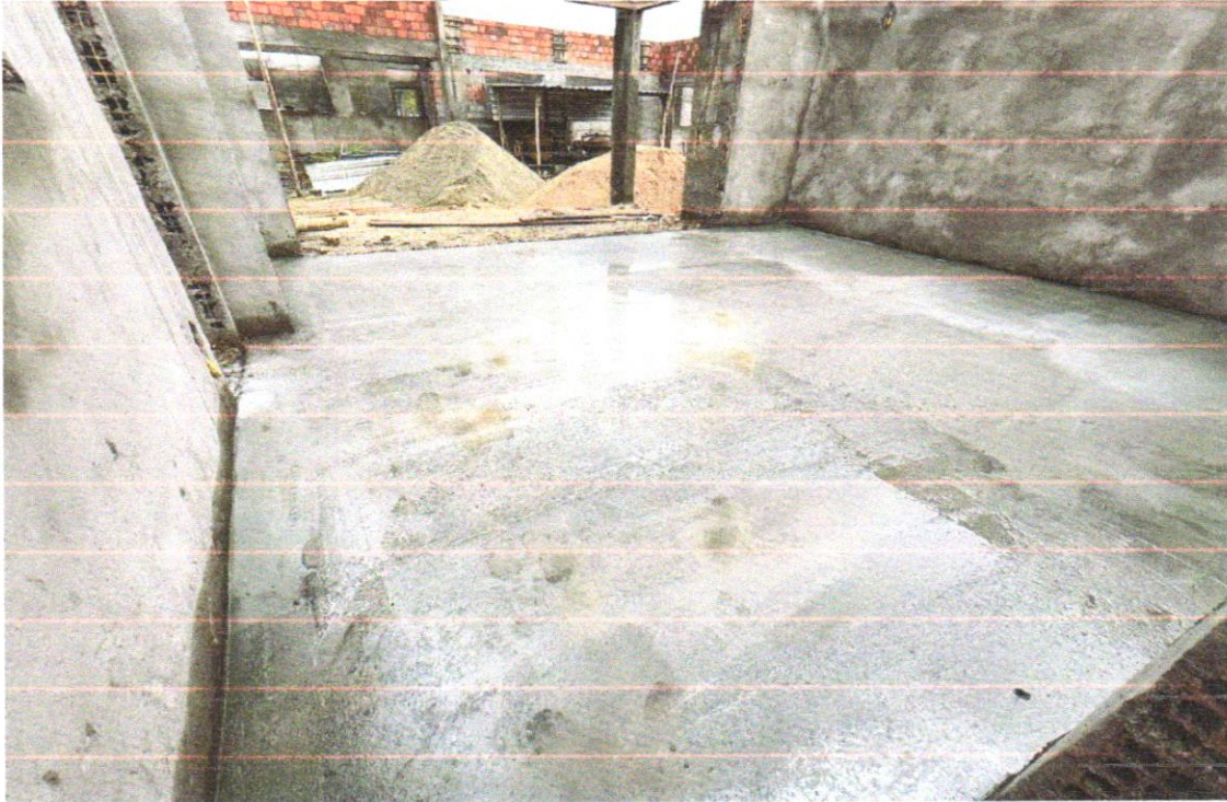
FOTO 20 - IMPERMEABILIZAÇÃO DE PISO COM ARGAMASSA DE CIMENTO E AREIA, COM ADITIVO IMPERMEABILIZANTE, E = 2CM. AF_06/2018

FOTO 19 - IMPERMEABILIZAÇÃO DE PISO COM ARGAMASSA DE CIMENTO E AREIA, COM ADITIVO IMPERMEABILIZANTE, E = 2CM. AF_06/2018