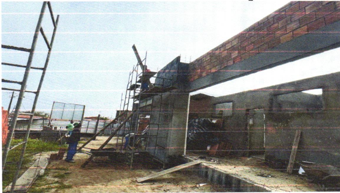
FOTO 14 - ALVENARIA DE VEDAÇÃO DE BLOCOS CERÂMICOS FURADOS NA VERTICAL DE 14X19X39CM (ESPESSURA 14CM) DE PAREDES COM ÁREA LÍQUIDA MAIOR OU IGUAL A 6M 2 COM VÃOS E ARGAMASSA DE ASSENTAMENTO COM PREPARO EM BETONEIRA. AF_06/2014

FOTO 13 - ALVENARIA DE VEDAÇÃO DE BLOCOS CERÂMICOS FURADOS NA VERTICAL DE 14X19X39CM (ESPESSURA 14CM) DE PAREDES COM ÁREA LÍQUIDA MAIOR OU IGUAL A 6M 2 COM VÃOS E ARGAMASSA DE ASSENTAMENTO COM PREPARO EM BETONEIRA. AF_06/2014