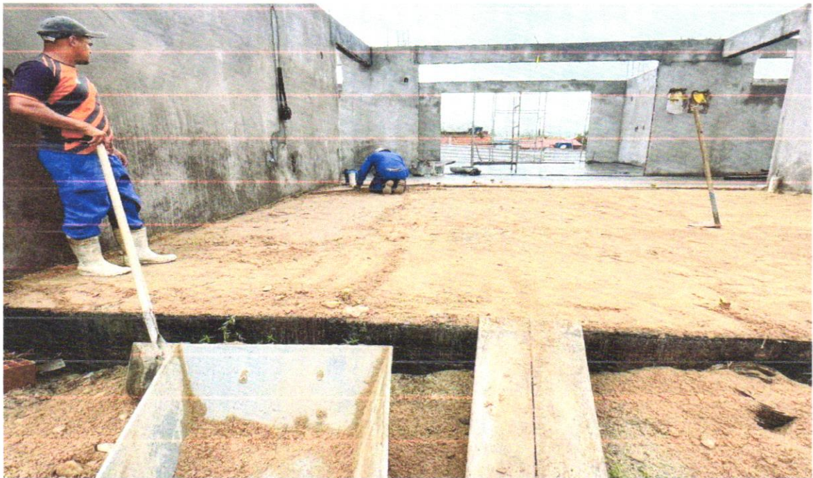
FOTO 04 – ATERRO MANUAL DE VALAS COM SOLO ARGILO-ARENOSO E COMPACTAÇÃO MECANIZADA. AF_05/2016