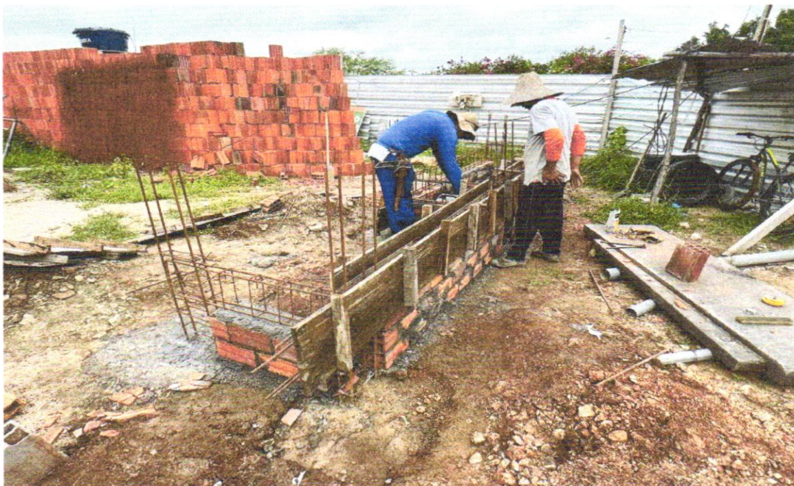
FOTO 10 – LASTRO DE CONCRETO MAGRO, APLICADO EM PISOS, LAJES SOBRE SOLO OU RADIERS, ESPESSURA DE 5 CM. AF_07/2016