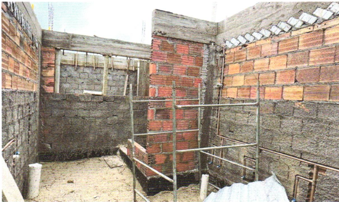
FOTO 06 – Concreto Bombeado fck= 25MPa; incluindo preparo, lançamento e adensamento