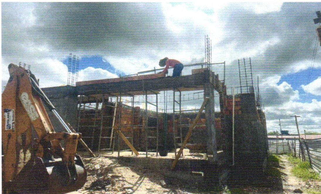
FOTO 18 - ALVENARIA DE VEDAÇÃO DE BLOCOS CERÂMICOS FURADOS NA VERTICAL DE 14X19X39CM (ESPESSURA 14CM) DE PAREDES COM ÁREA LÍQUIDA MAIOR OU IGUAL A 6M 2 COM VÃOS E ARGAMASSA DE ASSENTAMENTO COM PREPARO EM BETONEIRA. AF_06/2014

FOTO 17 - ALVENARIA DE VEDAÇÃO DE BLOCOS CERÂMICOS FURADOS NA VERTICAL DE 14X19X39CM (ESPESSURA 14CM) DE PAREDES COM ÁREA LÍQUIDA MAIOR OU IGUAL A 6M 2 COM VÃOS E ARGAMASSA DE ASSENTAMENTO COM PREPARO EM BETONEIRA. AF_06/2014