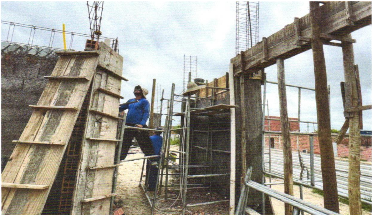
FOTO 04 – MONTAGEM E DESMONTAGEM DE FÔRMA DE VIGA, ESCORAMENTO COM GARFO DE MADEIRA, PÉ-DIREITO SIMPLES, EM CHAPA DE MADEIRA PLASTIFICADA, 12 UTILIZAÇÕES. AF_09/2020