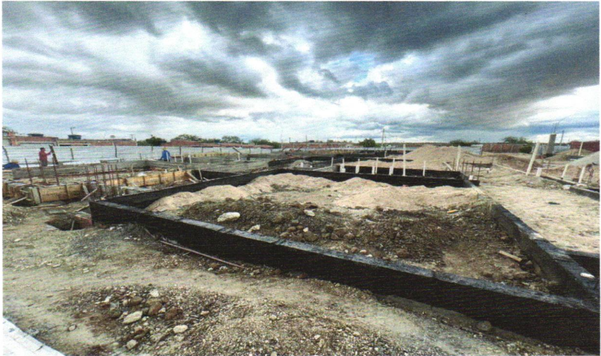
FOTO 10 – LASTRO DE CONCRETO MAGRO, APLICADO EM PISOS, LAJES SOBRE SOLO OU RADIERS, ESPESSURA DE 5 CM. AF_07/2016