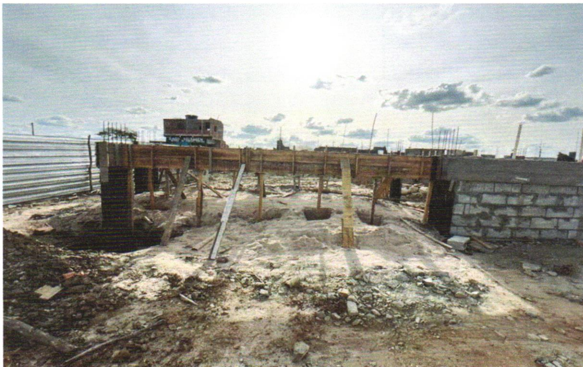
FOTO 22 – Concreto Bombeado fck= 25MPa; incluindo preparo, lançamento e adensamento

FOTO 21 – Concreto Bombeado fck= 25MPa; incluindo preparo, lançamento e adensamento