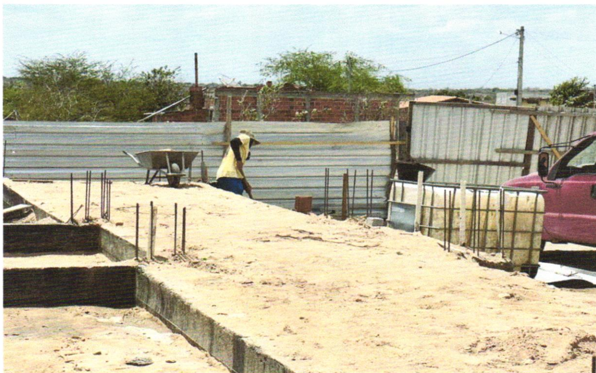
FOTO 08 – REATERRO MANUAL DE VALAS COM COMPACTAÇÃO MECANIZADA. AF_04/2016