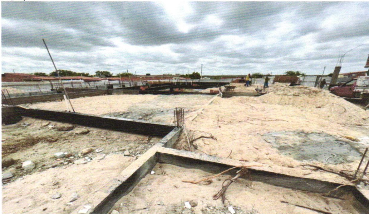
FOTO 04 – ATERRO MANUAL DE VALAS COM SOLO ARGILO-ARENOSO E COMPACTAÇÃO MECANIZADA. AF_05/2016