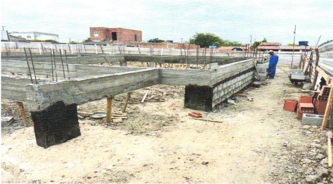
FOTO 14 – Armação de aço CA-50 Ø 8mm; incluso fornecimento, corte, dobra e colocação

FOTO 13 - LASTRO DE CONCRETO, PREPARO MECÂNICO, INCLUSOS ADITIVO IMPERMEABILIZANTE, LANÇAMENTO E ADENSAMENTO