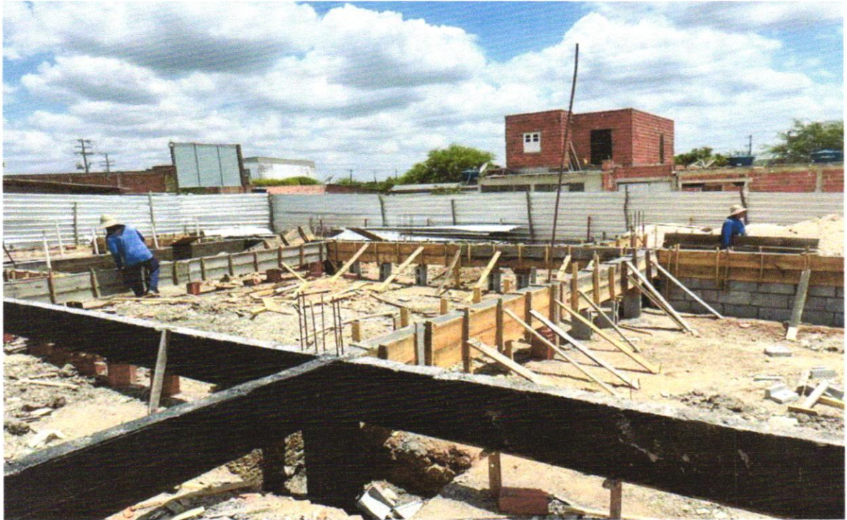
FOTO 20 – Concreto Bombeado fck= 25MPa; incluindo preparo, lançamento e adensamento

FOTO 19 -- FABRICAÇÃO, MONTAGEM E DESMONTAGEM DE FÔRMA PARA VIGA BALDRAME, EM MADEIRA SERRADA, E=25 MM, 4 UTILIZAÇÕES. AF_06/2017