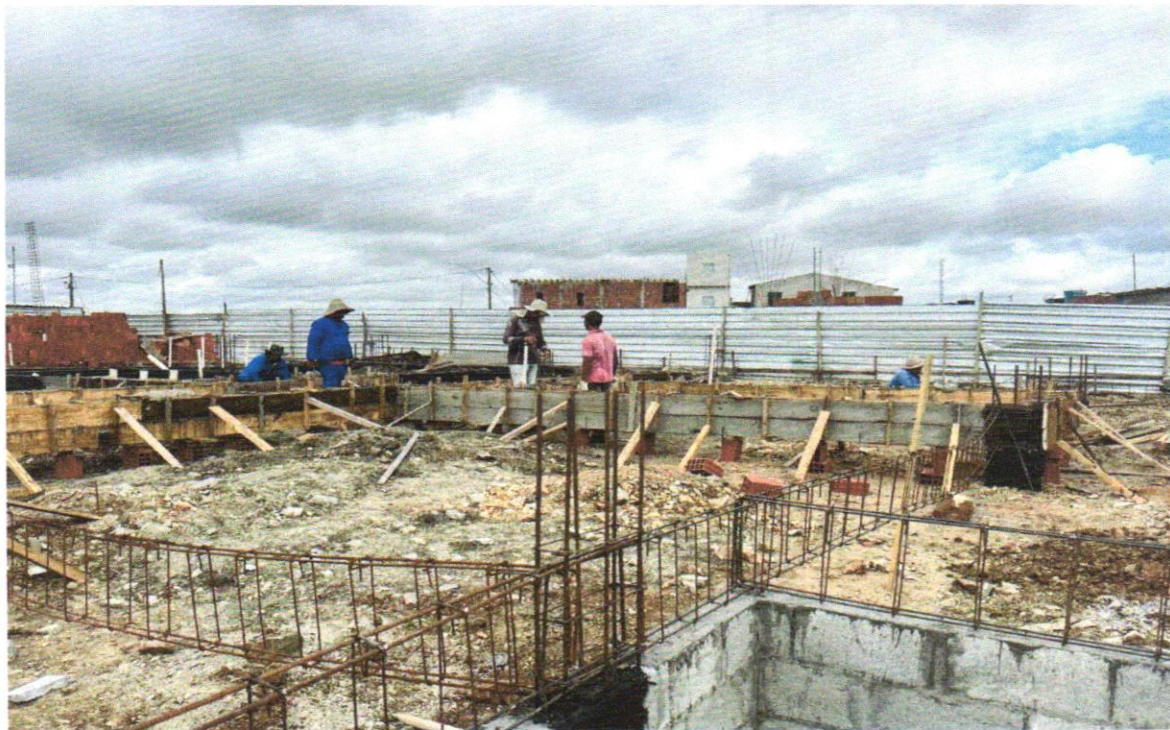
FOTO 16 – Armação de aço CA-60 Ø 5,0mm; incluso fornecimento, corte, dobra e colocação