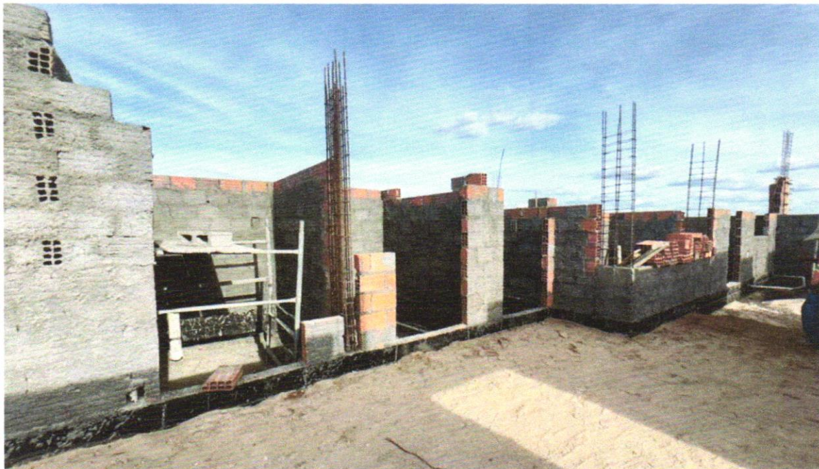
FOTO 06 – ATERRO MANUAL DE VALAS COM SOLO ARGILO-ARENOSO E COMPACTAÇÃO MECANIZADA. AF_05/2016