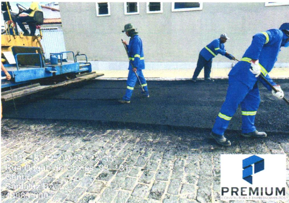
Foto 02- massa asfáltica.