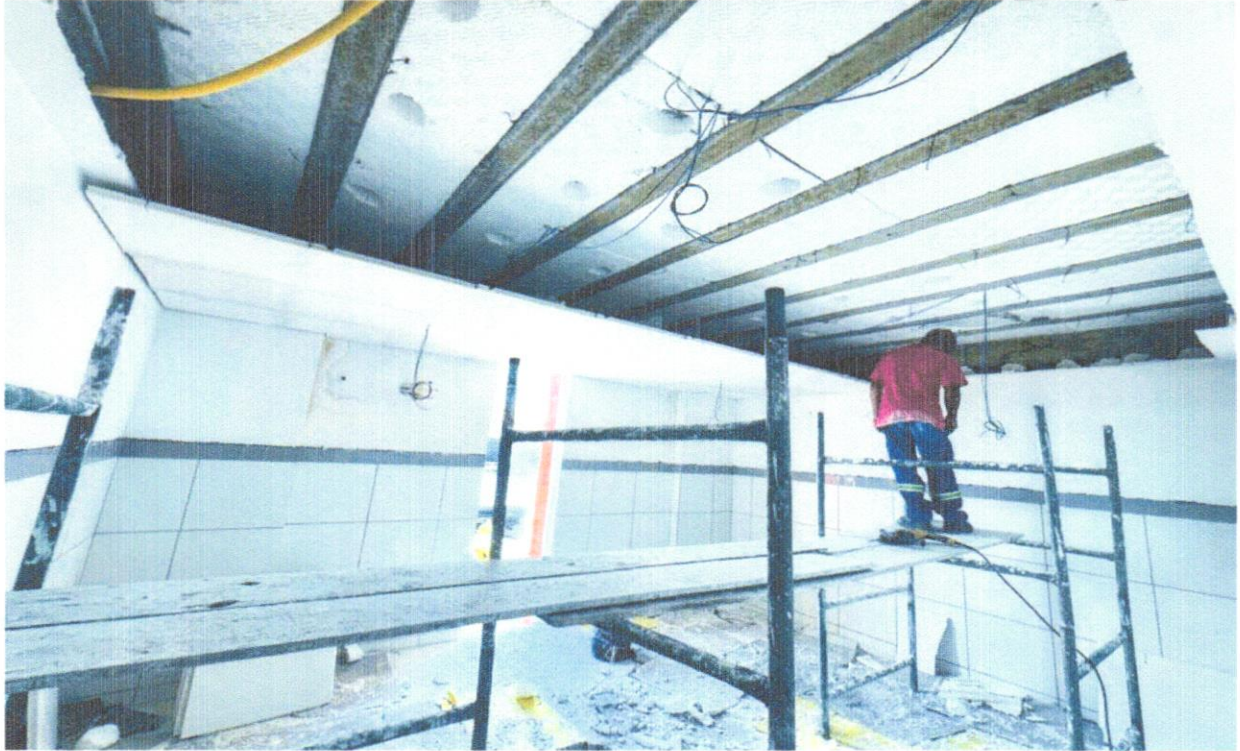
FOTO 20- FORRO EM PLACAS DE GESSO, PARA AMBIENTES COMERCIAIS. AF_05/2017_P