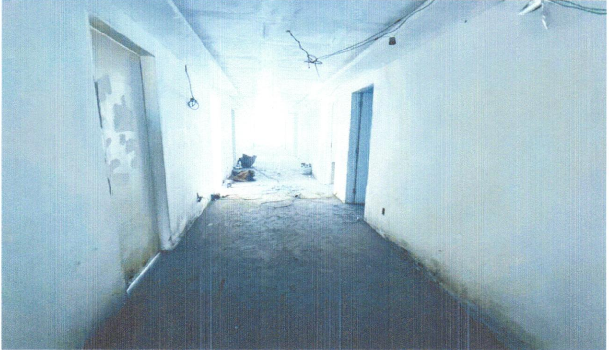
FOTO 06 - PISO VINÍLICO SEMI-FLEXÍVEL EM PLACAS, PADRÃO LISO, ESPESSURA 3,2 MM, FIXADO COM COLA. AF_09/2020

FOTO 05 - PISO VINÍLICO SEMI-FLEXÍVEL EM PLACAS, PADRÃO LISO, ESPESSURA 3,2 MM, FIXADO COM COLA. AF_09/2020