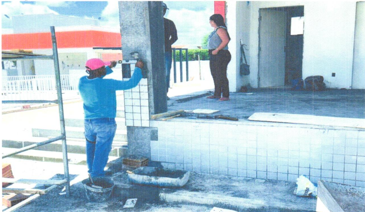
FOTO 02 - Revestimento cerâmico para parede, 10 x 10 cm, Eliane, linha galeria branco mesh, pei - 3, aplicado com argamassa industrializada ac-ii, rejuntado, exclusive regularização de base ou emboço - Rev 01

FOTO 01 - Revestimento cerâmico para parede, 10 x 10 cm, Eliane, linha galeria branco mesh, pei - 3, aplicado com argamassa industrializada ac-ii, rejuntado, exclusive regularização de base ou emboço - Rev 01