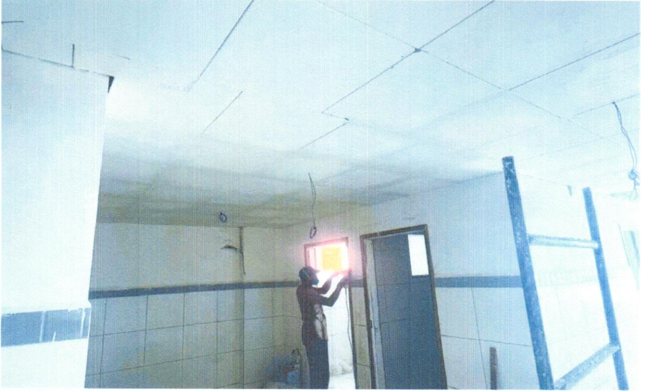
FOTO 22 - FORRO EM PLACAS DE GESSO, PARA AMBIENTES COMERCIAIS. AF_05/2017_P