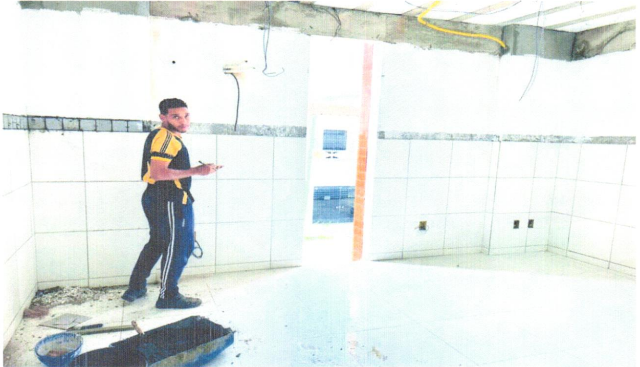
FOTO 04 - Revestimento cerâmico para parede, 10 x 10 cm, Eliane, linha galeria branco mesh, pei - 3, aplicado com argamassa industrializada ac-ii, rejuntado, exclusive regularização de base ou emboço - Rev 01

FOTO 03 - Revestimento cerâmico para parede, 10 x 10 cm, Eliane, linha galeria branco mesh, pei - 3, aplicado com argamassa industrializada ac-ii, rejuntado, exclusive regularização de base ou emboço - Rev 01