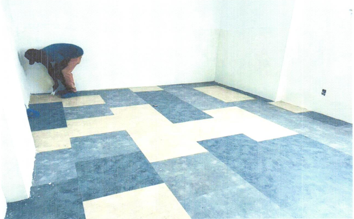
FOTO 10 - PISO VINÍLICO SEMI-FLEXÍVEL EM PLACAS, PADRÃO LISO, ESPESSURA 3,2 MM, FIXADO COM COLA. AF_09/2020