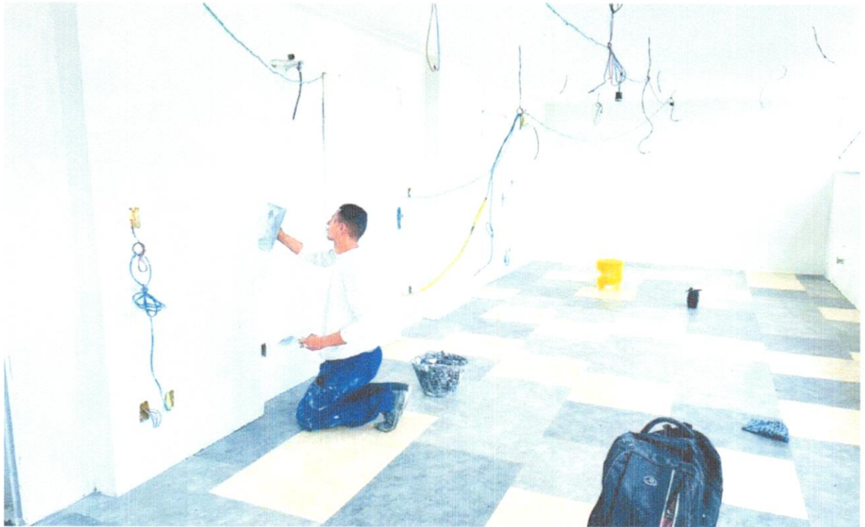
FOTO 24 - EMASSAMENTO COM MASSA A OLEO, DUAS DEMAS