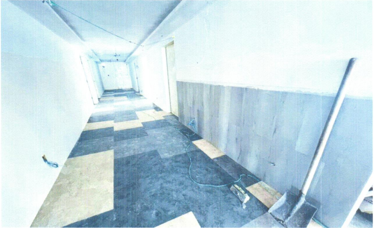
FOTO 12 PISO VINÍLICO SEMI-FLEXÍVEL EM PLACAS, PADRÃO LISO, ESPESSURA 3,2 MM, FIXADO COM COLA. AF_09/2020