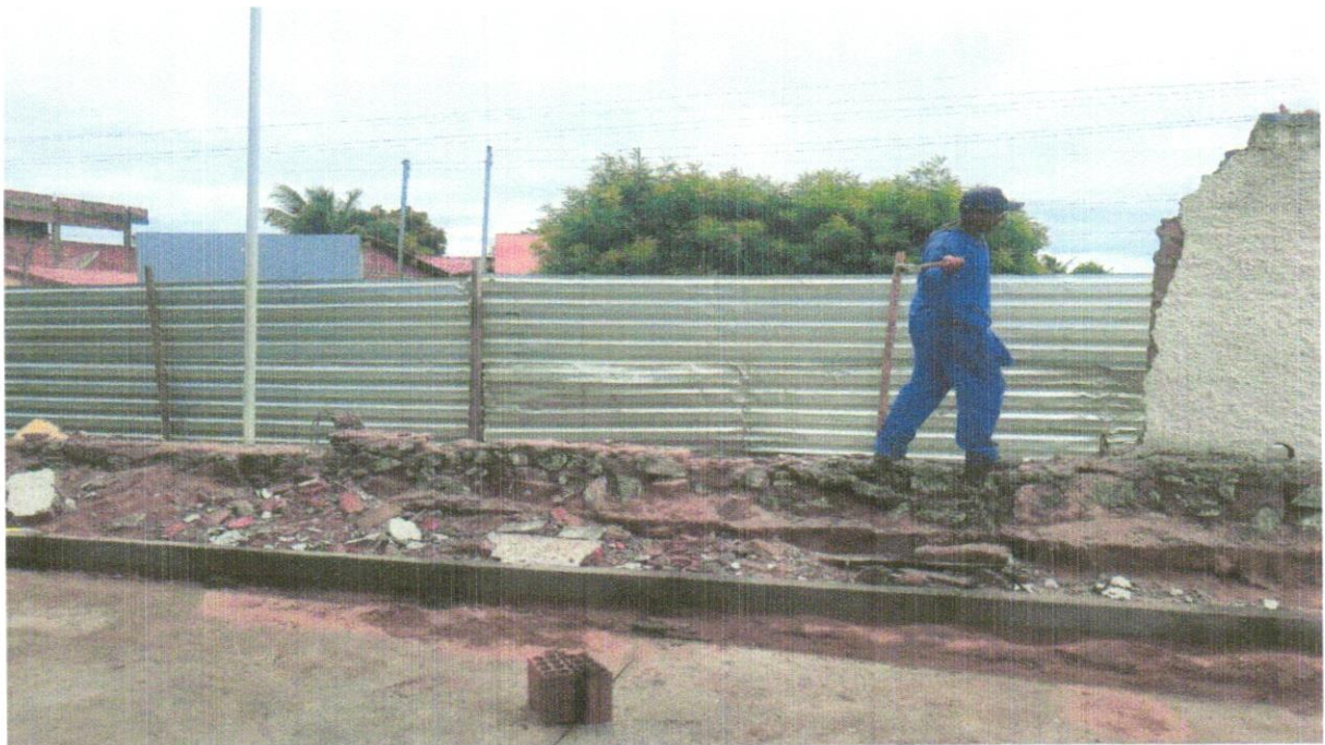
FOTO 02 - DEMOLIÇÃO DE ALVENARIA DE BLOCO FURADO, DE FORMA MANUAL, SEM REAPROVEITAMENTO. AF_12/2017