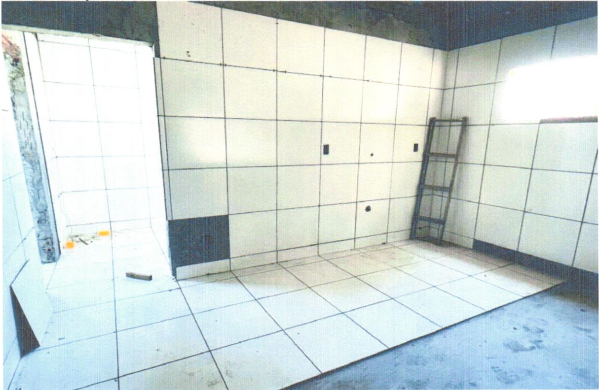
FOTO 14 - Revestimento cerâmico para piso ou parede, 34 x 46 cm, Elizabeth, linha Linho, cor Branco Brilhante, aplicado com argamassa industrializada ac-ii, rejuntado, exclusive regularização de base ou emboço