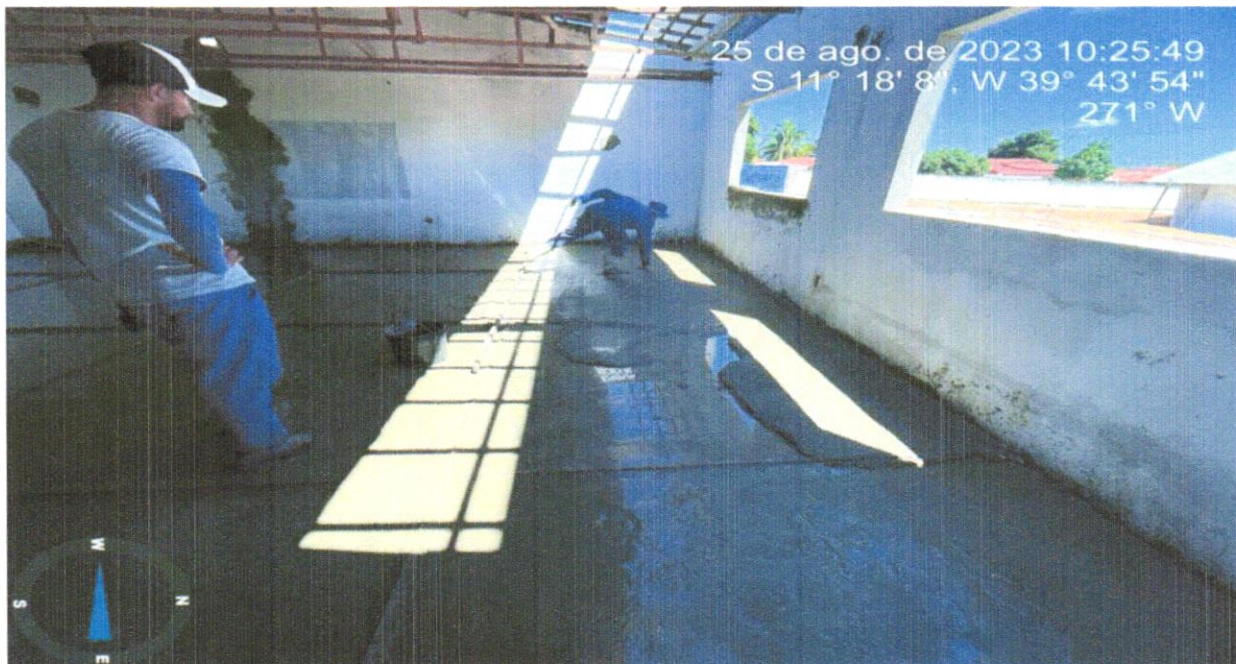
FOTO 22 - APLICAÇÃO E LIXAMENTO DE MASSA LÁTEX EM PAREDES, UMA DEMÃO.

FOTO 21 - PISO EM GRANILITE, MARMORITE OU GRANITINA EM AMBIENTES INTERNOS, COM ESPESSURA DE 8 MM, INCLUSO MISTURA EM BETONEIRA, COLOCAÇÃO DAS JUNTAS, APLICAÇÃO DO PISO, 4 POLIMENTOS COM POLITRIZ, ESTUCAMENTO, SELADOR E CERA. AF_06/2022