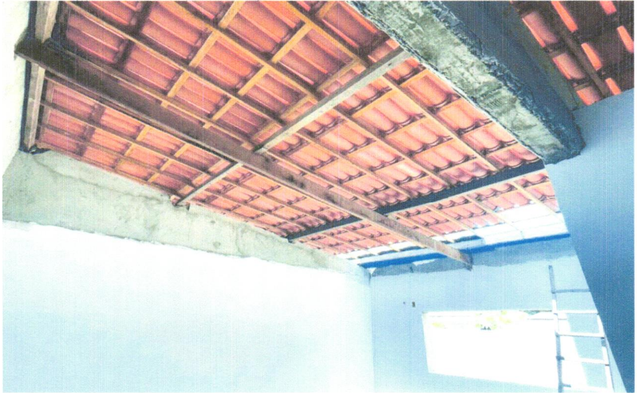
FOTO 10 - Forro de pvc, em régulas de 10 ou 20 cm, aplicado, inclusive estrutura para fixação (perfis em PVC) marca Araforros ou similar, instalado - Rev 06_10/2021 AF_06/2016_P