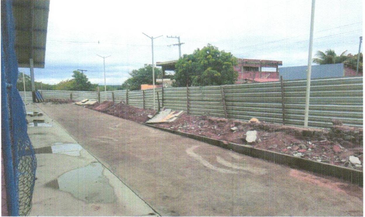
FOTO 04 - TAPUME COM TELHA METÁLICA. AF_05/2018