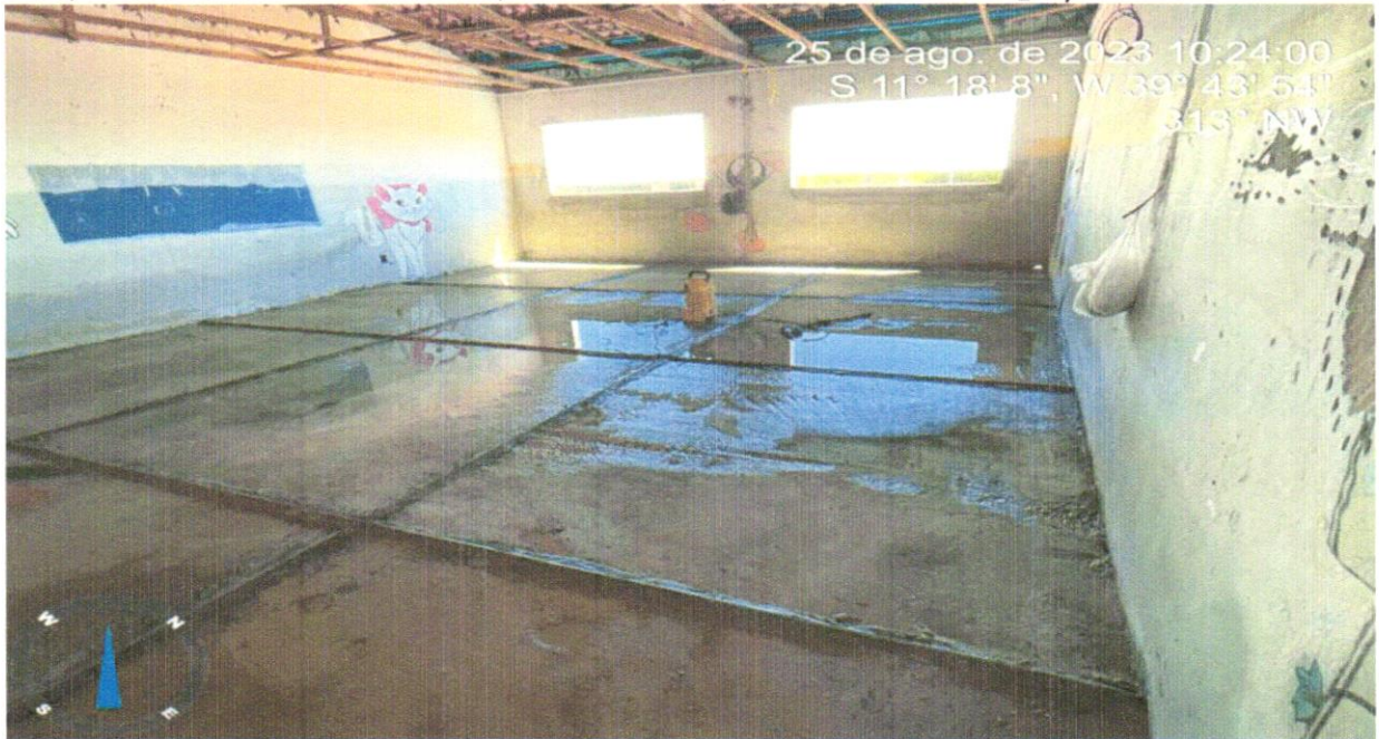
FOTO 22 - PISO EM GRANILITE, MARMORITE OU GRANITINA EM AMBIENTES INTERNOS, COM ESPESSURA DE 8 MM, INCLUSO MISTURA EM BETONEIRA, COLOCAÇÃO DAS JUNTAS, APLICAÇÃO DO PISO, 4 POLIMENTOS COM POLITRIZ, ESTUCAMENTO, SELADOR E CERA. AF_06/2022

FOTO 21 - PISO EM GRANILITE, MARMORITE OU GRANITINA EM AMBIENTES INTERNOS, COM ESPESSURA DE 8 MM, INCLUSO MISTURA EM BETONEIRA, COLOCAÇÃO DAS JUNTAS, APLICAÇÃO DO PISO, 4 POLIMENTOS COM POLITRIZ, ESTUCAMENTO, SELADOR E CERA. AF_06/2022