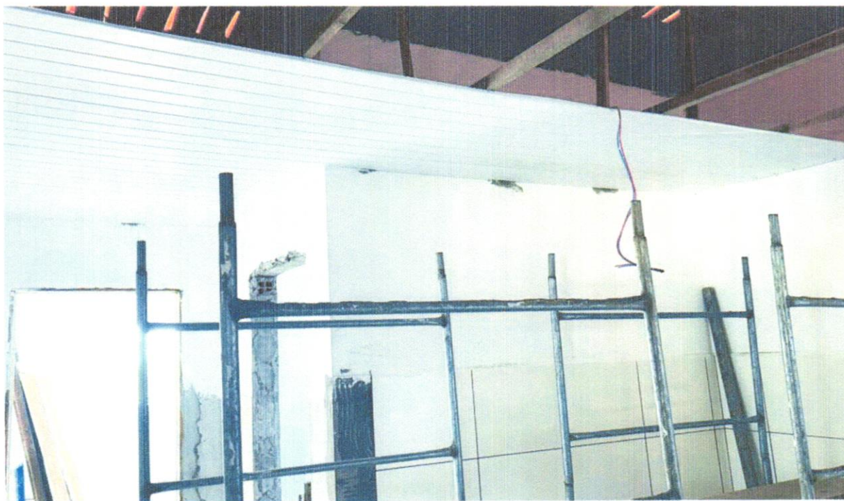
FOTO 12 - Forro de pvc, em régulas de 10 ou 20 cm, aplicado, inclusive estrutura para fixação (perfis em PVC) marca Araforros ou similar, instalado - Rev 06_10/2021 AF_06/2016_P