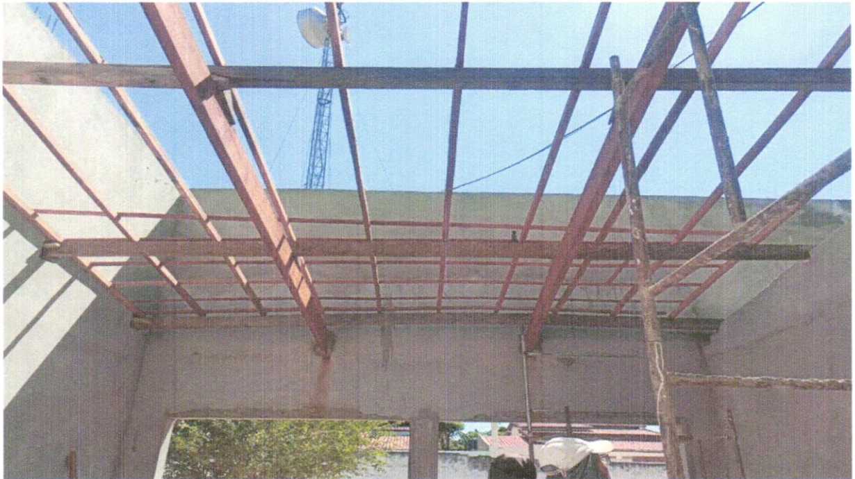
FOTO 08 - TELHAMENTO COM TELHA CERÂMICA DE ENCAIXE, TIPO ROMANA, COM ATÉ 2 ÁGUAS, INCLUSO TRANSPORTE VERTICAL. AF_07/2019