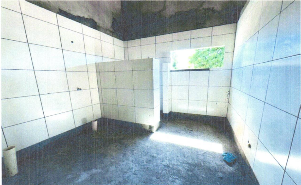
FOTO 18 - Revestimento cerâmico para parede, 10 x 10 cm, Tecnogres, linha Brilhante, ref. BR10060 ou similar, aplicado com argamassa industrializada ac-iii, rejuntado, exclusive regularização de base ou emboço - Rev 04