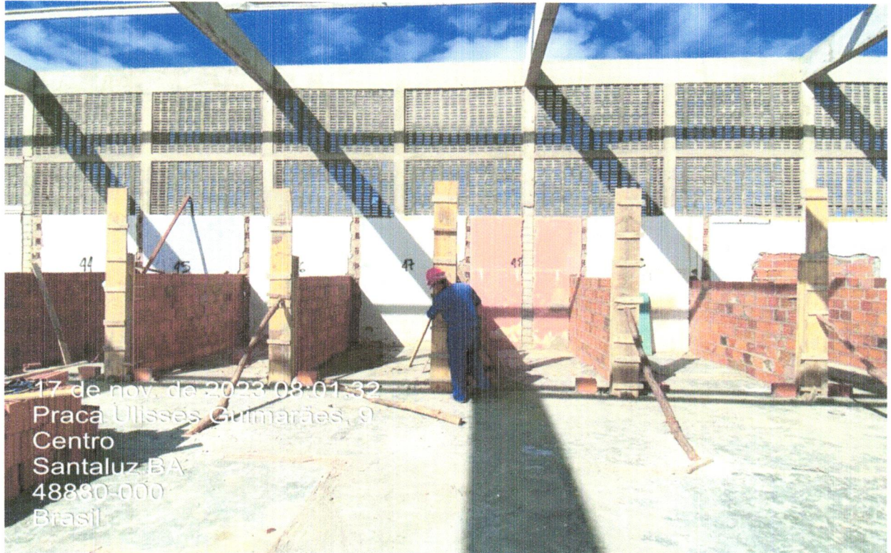
FOTO 04 - ALVENARIA DE VEDAÇÃO DE BLOCOS CERÂMICOS FURADOS NA HORIZONTAL DE 9X19X19CM (ESPESSURA 9CM) DE PAREDES COM ÁREA LÍQUIDA MAIOR OU IGUAL A 6M² SEM VÃOS E ARGAMASSA DE ASSENTAMENTO COM PREPARO EM BETONEIRA. AF_06/2014

FOTO 03 - ALVENARIA DE VEDAÇÃO DE BLOCOS CERÂMICOS FURADOS NA HORIZONTAL DE 9X19X19CM (ESPESSURA 9CM) DE PAREDES COM ÁREA LÍQUIDA MAIOR OU IGUAL A 6M² SEM VÃOS E ARGAMASSA DE ASSENTAMENTO COM PREPARO EM BETONEIRA. AF_06/2014