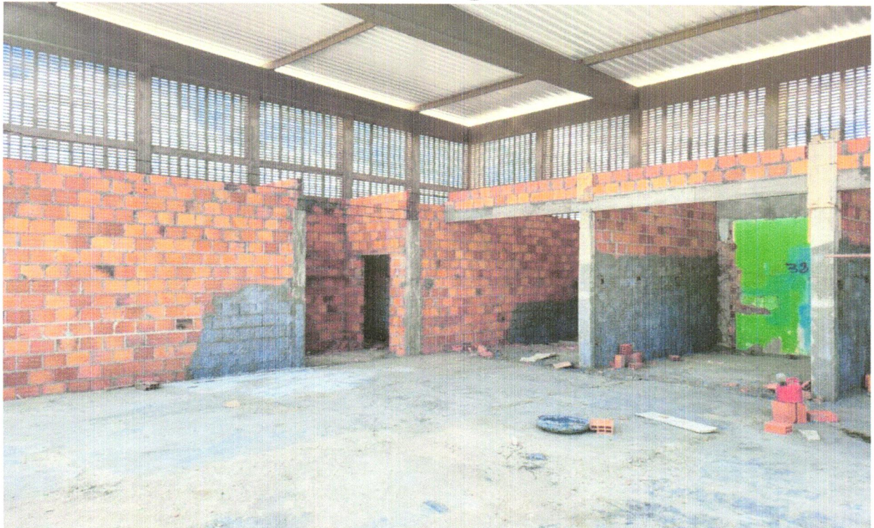
FOTO 06 - ALVENARIA DE VEDAÇÃO DE BLOCOS CERÂMICOS FURADOS NA HORIZONTAL DE 9X19X19CM (ESPESSURA 9CM) DE PAREDES COM ÁREA LÍQUIDA MAIOR OU IGUAL A 6M 2 SEM VÃOS E ARGAMASSA DE ASSENTAMENTO COM PREPARO EM BETONEIRA. AF_06/2014

FOTO 05 - ALVENARIA DE VEDAÇÃO DE BLOCOS CERÂMICOS FURADOS NA HORIZONTAL DE 9X19X19CM (ESPESSURA 9CM) DE PAREDES COM ÁREA LÍQUIDA MAIOR OU IGUAL A 6M 2 SEM VÃOS E ARGAMASSA DE ASSENTAMENTO COM PREPARO EM BETONEIRA. AF_06/2014