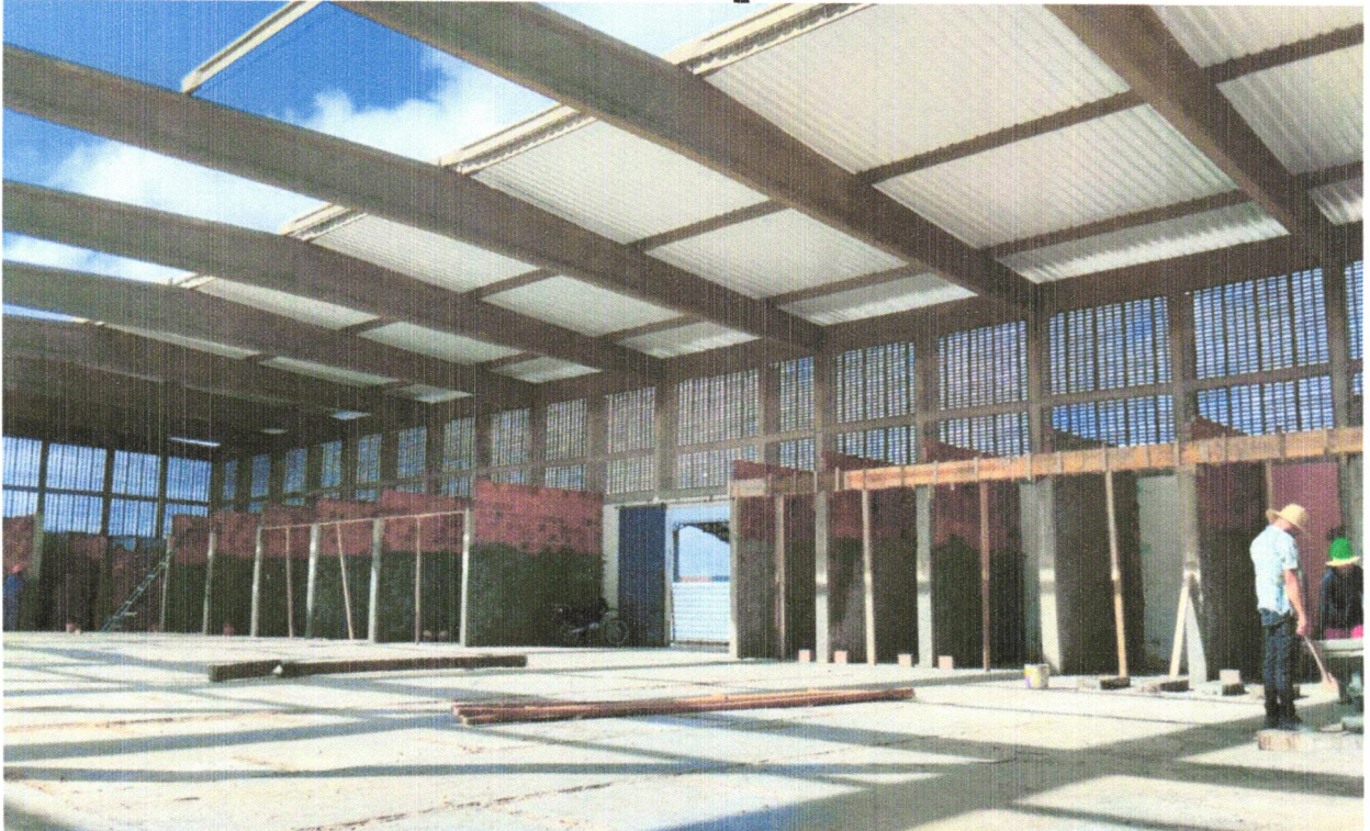
FOTO 08 - ALVENARIA DE VEDAÇÃO DE BLOCOS CERÂMICOS FURADOS NA HORIZONTAL DE 9X19X19CM (ESPESSURA 9CM) DE PAREDES COM ÁREA LÍQUIDA MAIOR OU IGUAL A 6M 2 SEM VÃOS E ARGAMASSA DE ASSENTAMENTO COM PREPARO EM BETONEIRA. AF_06/2014

FOTO 07 - ALVENARIA DE VEDAÇÃO DE BLOCOS CERÂMICOS FURADOS NA HORIZONTAL DE 9X19X19CM (ESPESSURA 9CM) DE PAREDES COM ÁREA LÍQUIDA MAIOR OU IGUAL A 6M 2 SEM VÃOS E ARGAMASSA DE ASSENTAMENTO COM PREPARO EM BETONEIRA. AF_06/2014