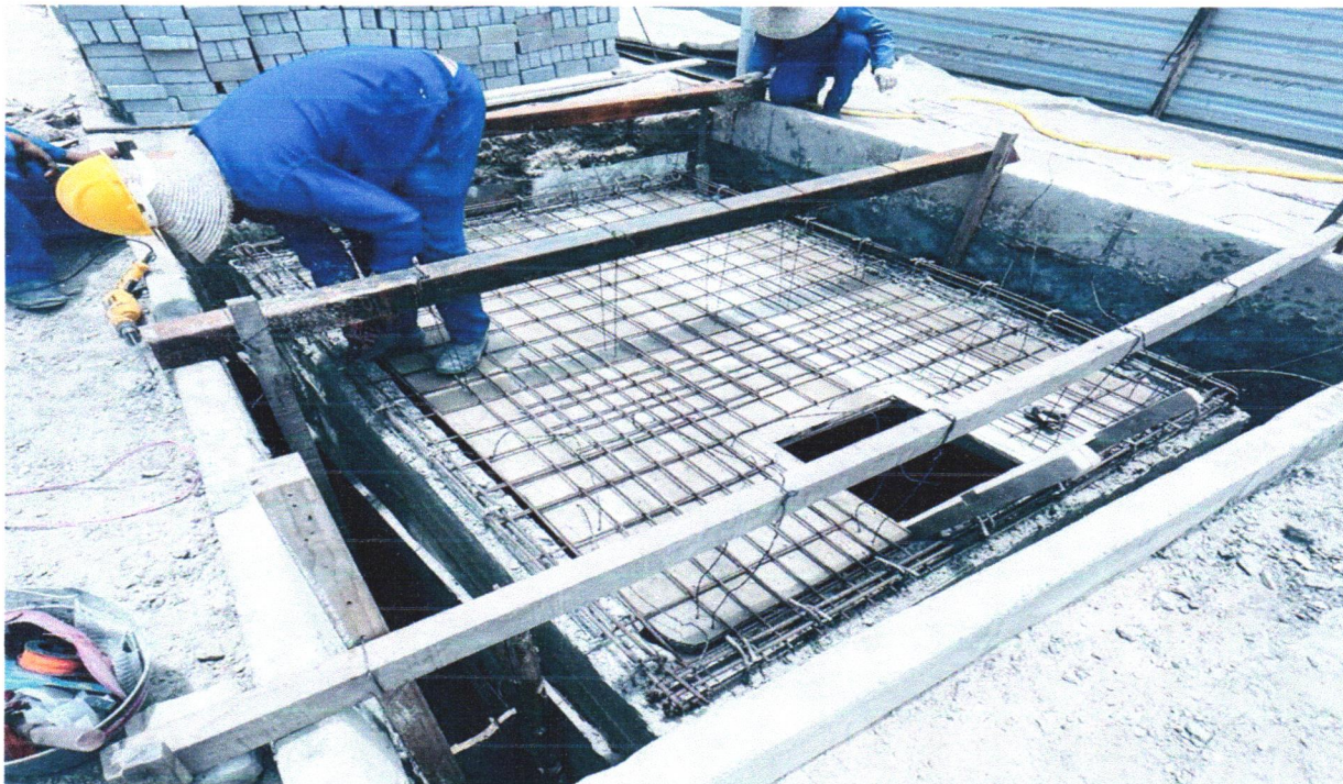
FOTO 04 - CONCRETO FCK = 25MPA, TRAÇO 1:2,3:2,7 (EM MASSA SECA DE CIMENTO/ AREIA MÉDIA/ BRITA 1) - PREPARO MECÂNICO COM BETONEIRA 400 L. AF_05/2021

FOTO 03 - CONCRETO FCK = 25MPA, TRAÇO 1:2,3:2,7 (EM MASSA SECA DE CIMENTO/ AREIA MÉDIA/ BRITA 1) - PREPARO MECÂNICO COM BETONEIRA 400 L. AF_05/2021