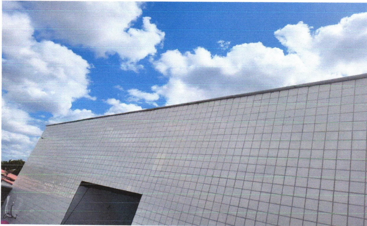
FOTO 08 - CHAPIM DE CONCRETO PRÉ-MOLDADO