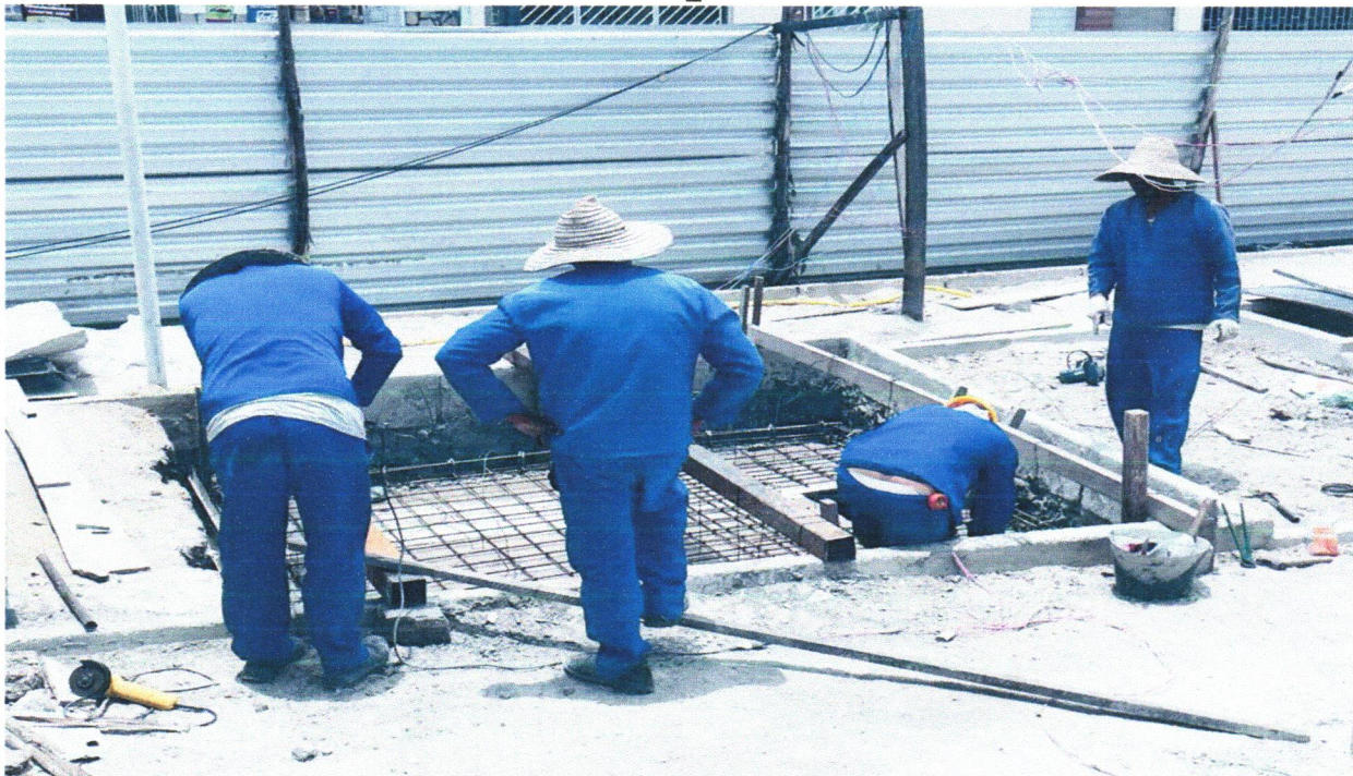
FOTO 02 - CONCRETO FCK = 25MPA, TRAÇO 1:2,3:2,7 (EM MASSA SECA DE CIMENTO/ AREIA MÉDIA/ BRITA 1) - PREPARO MECÂNICO COM BETONEIRA 400 L. AF_05/2021

FOTO 01 - CONCRETO FCK = 25MPA, TRAÇO 1:2,3:2,7 (EM MASSA SECA DE CIMENTO/ AREIA MÉDIA/ BRITA 1) - PREPARO MECÂNICO COM BETONEIRA 400 L. AF_05/2021