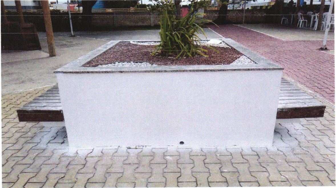
FOTO 08 - EMASSAMENTO DE PAREDES DO CANTEIRO.