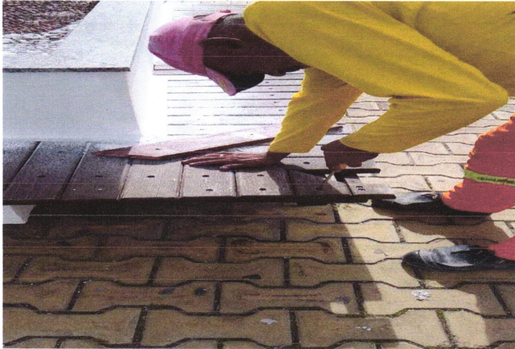
FOTO 10 - REPARAÇÃO DOS BANCOS DE MADEIRA