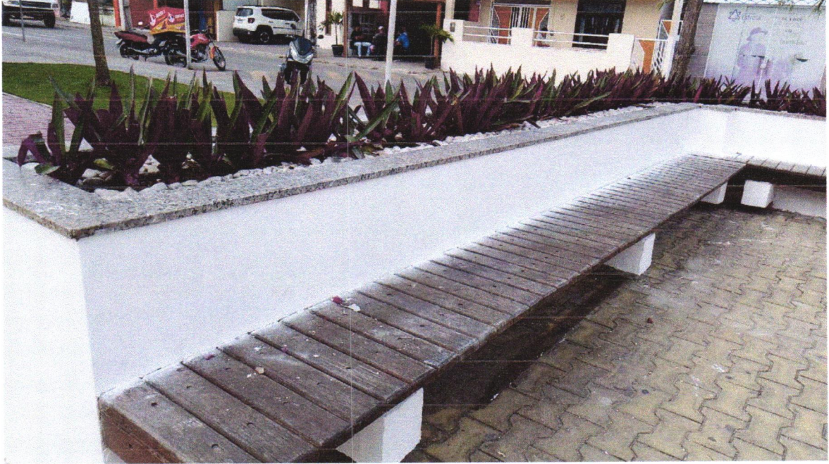
FOTO 06 - EMASSAMENTO DE PAREDES DO CANTEIRO.