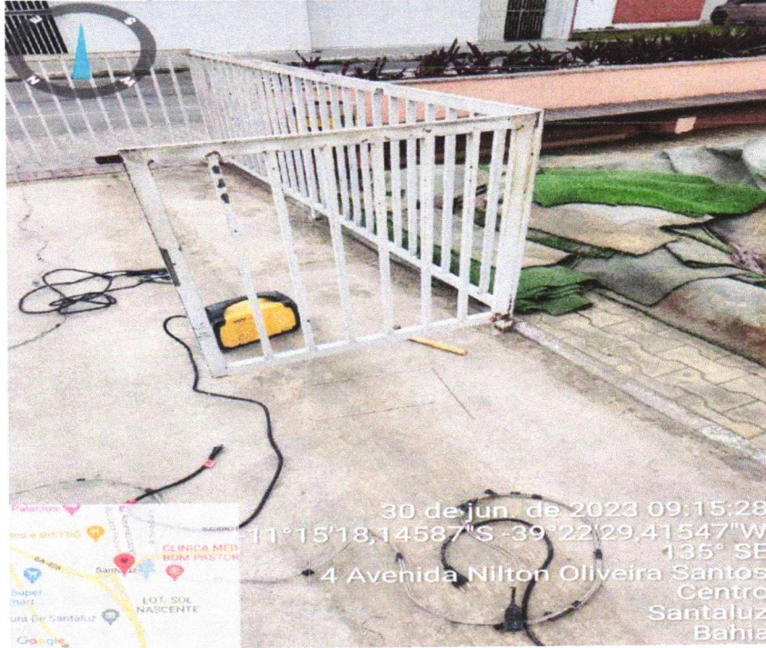
FOTO 04 - REMOÇÃO DE GRAMA SINTÉTICA