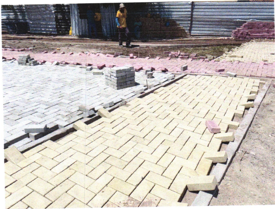
Foto 09- EXECUÇÃO DE PASSEIO EM PISO INTERTRAVADO, COM BLOCO RETANGULAR COLORIDO DE 20 X 10 CM, ESPESSURA 6 CM. AF_12/2015