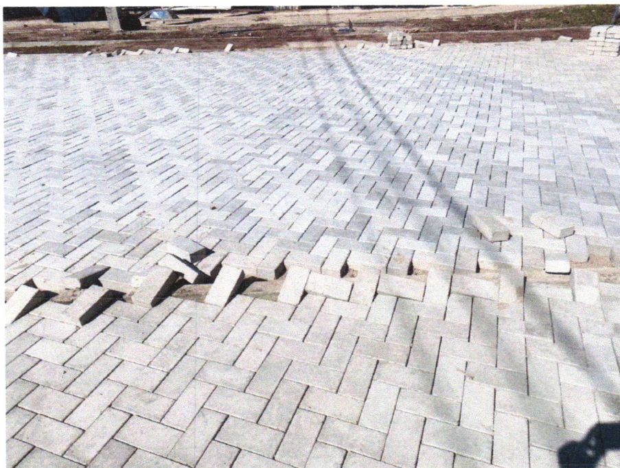
Foto 08 – EXECUÇÃO DE PASSEIO EM PISO INTERTRAVADO, COM BLOCO RETANGULAR COM NATURAL DE 20 X 10 CM, ESPESSURA 6 CM. AF_12/2015

Julia Varjão Julia Varjão Engenheira Civil CREA-BA 300041424