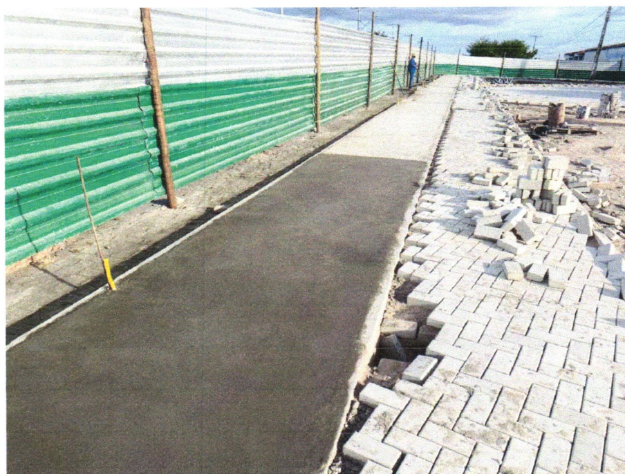
Foto 06 - EXECUÇÃO DE PASSEIO (CALÇADA) OU PISO DE CONCRETO COM CONCRETO MOLDADO IN LOCO, FEITO EM OBRA, ACABAMENTO CONVENCIONAL, ESPESSURA 6 CM, ARMADO. AF_07/2016

Júlia Varjão Júlia Varjão Engenheira Civil CREA-BA 3000041424