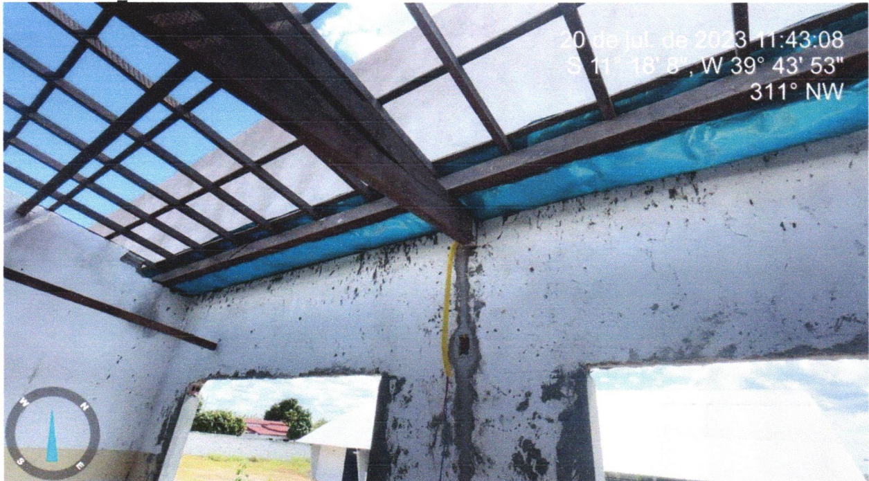
FOTO 06 - TRAMA DE MADEIRA COMPOSTA POR RIPAS, CAIBROS E TERÇAS PARA TELHADOS DE MAIS QUE 2 ÁGUAS PARA TELHA CERÂMICA CAPA-CANAL, INCLUSO TRANSPORTE VERTICAL. AF_07/2019

FOTO 05 - TRAMA DE MADEIRA COMPOSTA POR RIPAS, CAIBROS E TERÇAS PARA TELHADOS DE MAIS QUE 2 ÁGUAS PARA TELHA CERÂMICA CAPA-CANAL, INCLUSO TRANSPORTE VERTICAL. AF_07/2019