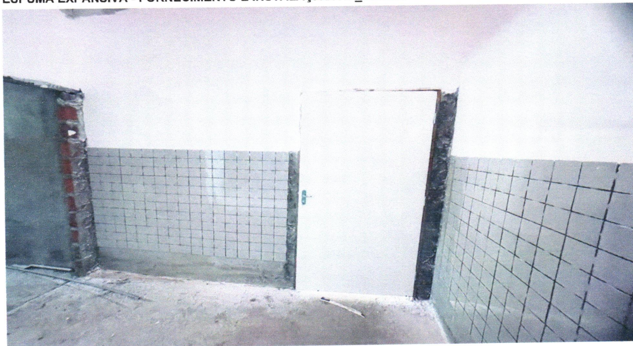
FOTO 02 - KIT DE PORTA-PRONTA DE MADEIRA EM ACABAMENTO MELAMÍNICO BRANCO, FOLHA LEVE OU MÉDIA, 80X210CM, EXCLUSIVE FECHADURA, FIXAÇÃO COM PREENCHIMENTO PARCIAL DE ESPUMA EXPANSIVA - FORNECIMENTO E INSTALAÇÃO. AF_12/2019