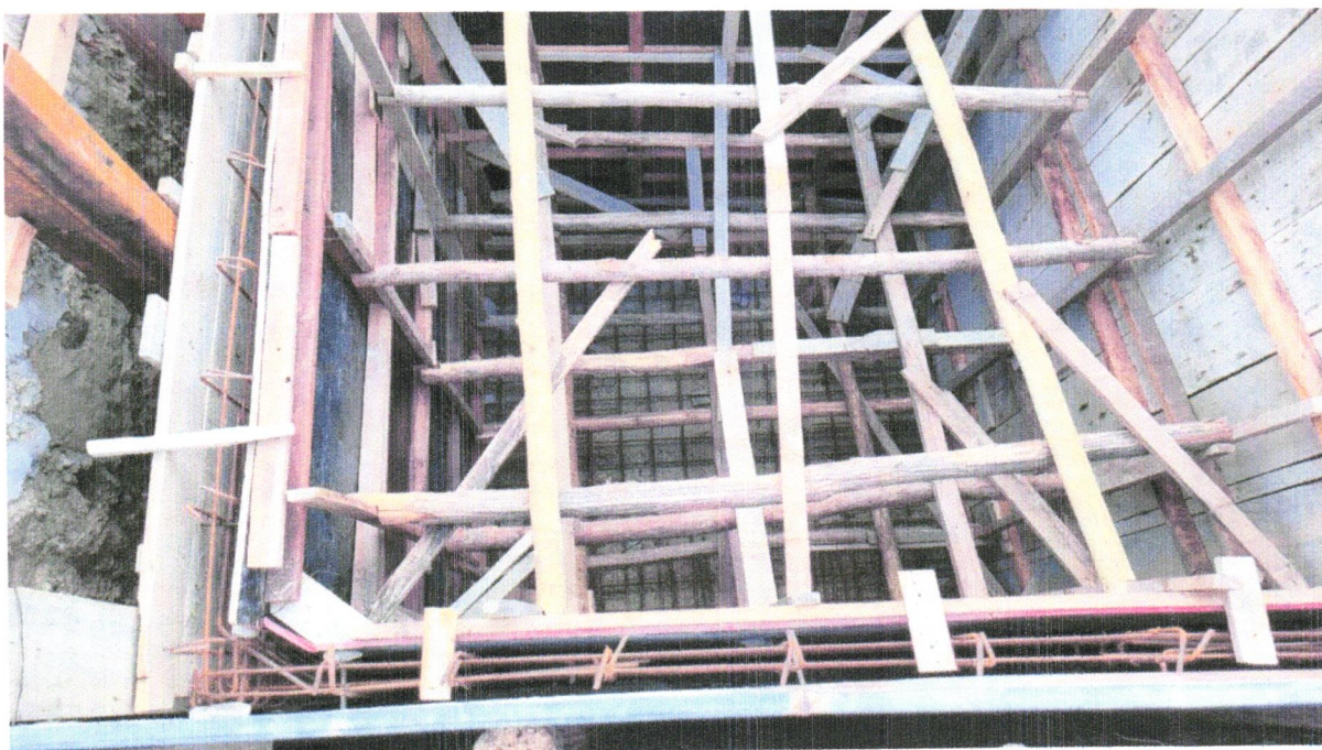
FOTO 02 - CONCRETO FCK = 25MPa, TRAÇO 1:2,3:2,7 (EM MASSA SECA DE CIMENTO/ AREIA MÉDIA/ BRITA 1) - PREPARO MECÂNICO COM BETONEIRA 400 L. AF_05/2021