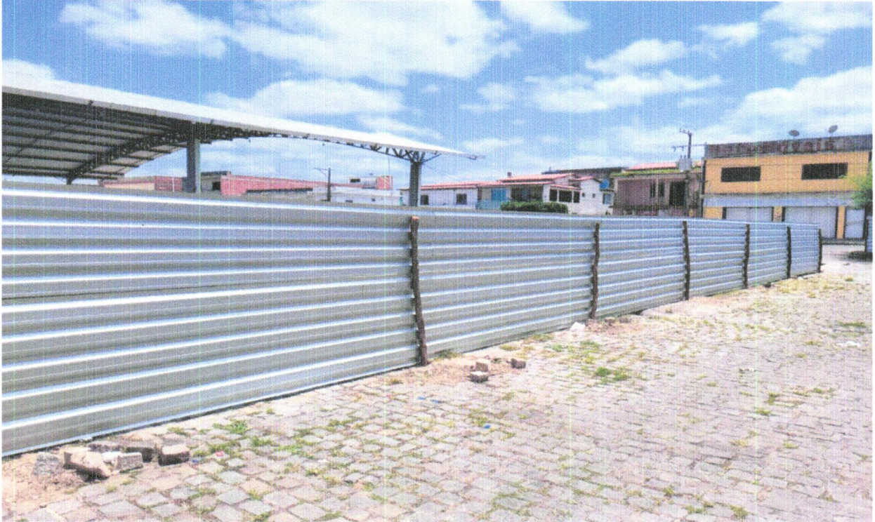
FOTO 08 - TAPUME COM TELHA METÁLICA. AF_05/2018