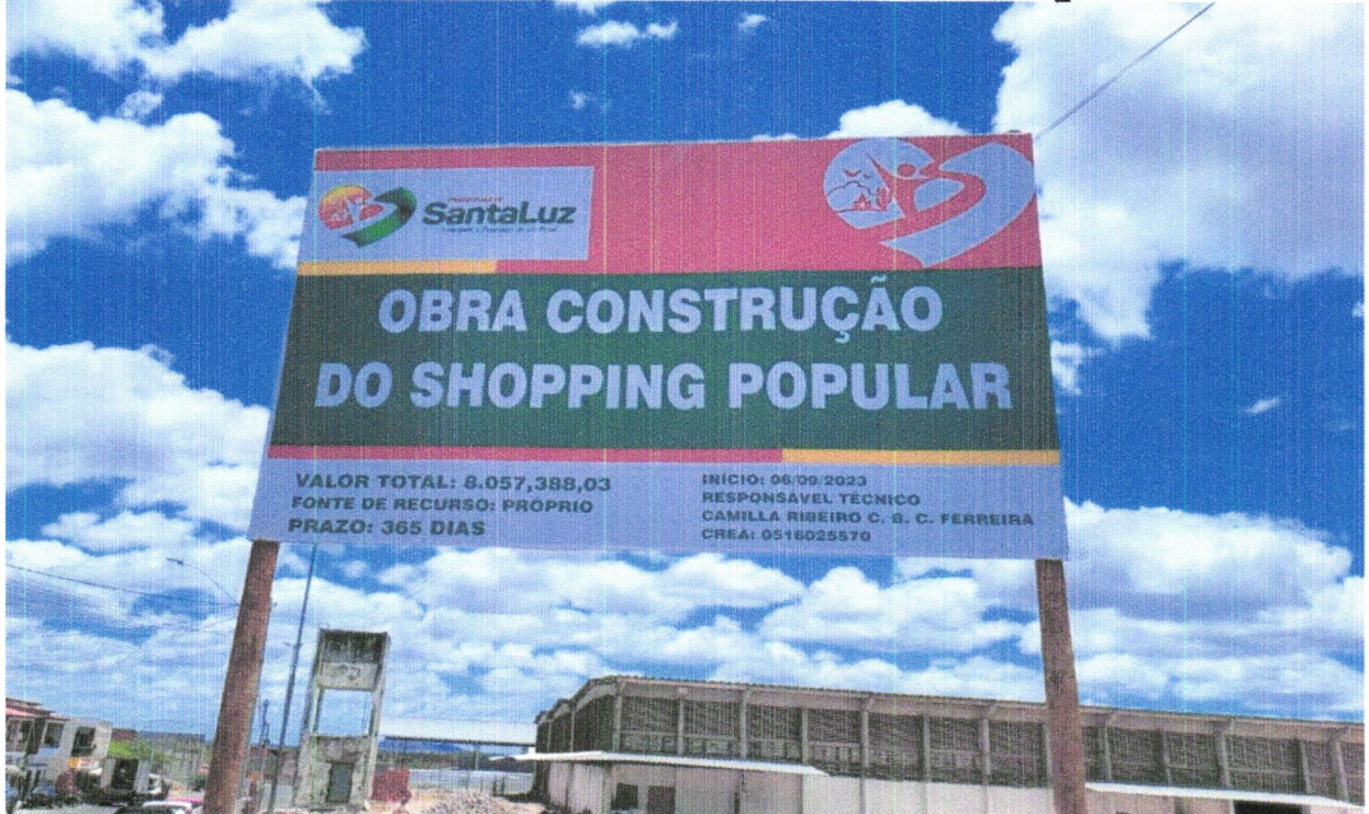
FOTO 02 - PLACA DE OBRA EM CHAPA AÇO GALVANIZADO, INSTALADA - REV 02_01/2022

FOTO 01 - PLACA DE OBRA EM CHAPA AÇO GALVANIZADO, INSTALADA - REV 02_01/2022