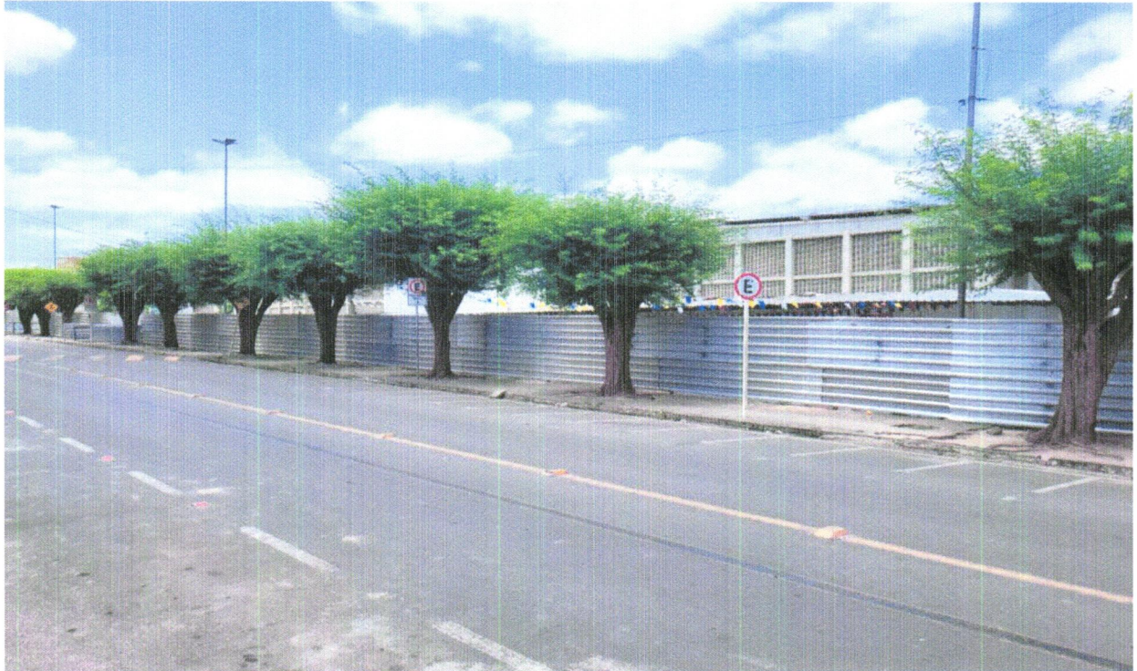
FOTO 04 - TAPUME COM TELHA METÁLICA. AF_05/2018