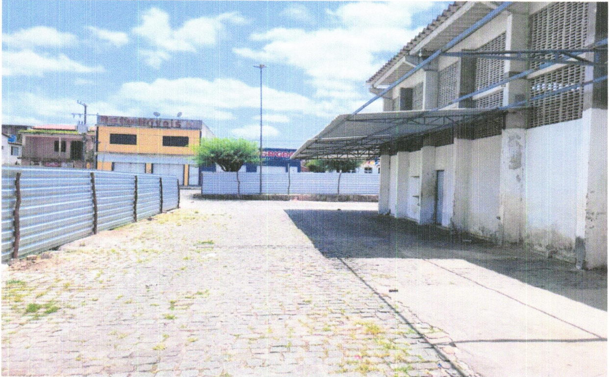
FOTO 06 - TAPUME COM TELHA METÁLICA. AF_05/2018